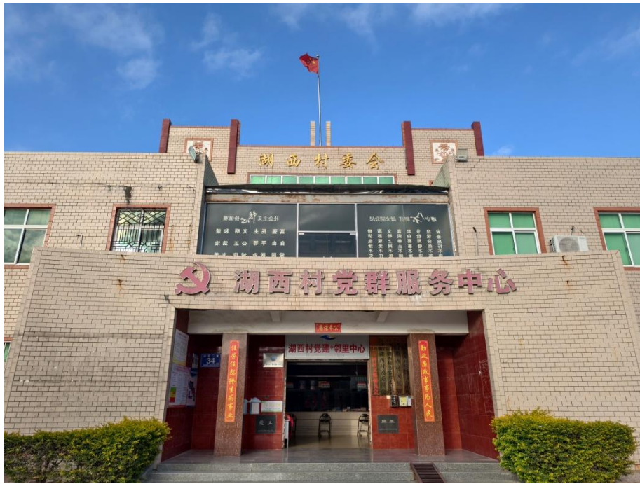
5. 湖西村便民服务站，地址：湖西村二区 34 号。